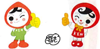
人権キャラクターイメージ 人KENまもる君 人KENあゆみちゃん