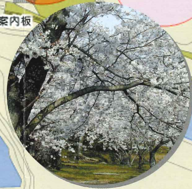
サクラ[ヤエザクラ] (4月中旬～4月末)