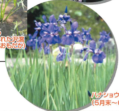
ハナショウブ (5月末～6月初旬)