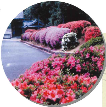
サツキ (5月中旬～6月初旬)