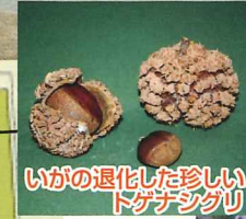
いがの退化した珍しい トゲナシグリ