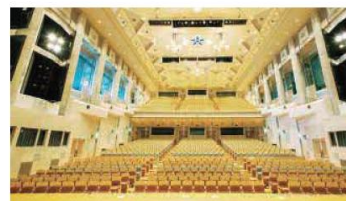
コンサートホール

シンフォニア岩国は、クラシック音楽やオペラに対応した、西日本有数の響きを誇る本格的なコンサートホールを始め、音楽会・演劇・伝統芸能・講演会・展示会など、様々な用途に対応した施設を備え、お客さまのご要望にお応えしています。JR岩国駅や岩国錦帯橋空港など県内外からのアクセスが便利なおうえ、山口県岩国総合庁舎とも併設し、多くのお客さまが行き交う場所として親しまれています。