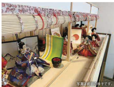
写真は前回の様子です。